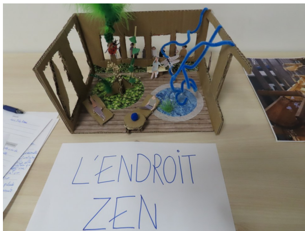
Exemple de maquette réalisée lors des « Ateliers

- Il y avait plein d'idées, mais les grandes idées c'est d'avoir des espaces différents de sorte que tout le monde s'y retrouve : des espaces calmes, d'autres où on puisse se retrouver tous ensemble. Des espaces de convivialité, des espaces pour s'occuper, des espaces qui soient agréables à habiter, il y aura des arbres, de la végétation, de l'eau, des endroits pour s'installer, des endroits sympas pour marcher.